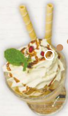
Puchar Lodowy z owocami Ice Cream cup