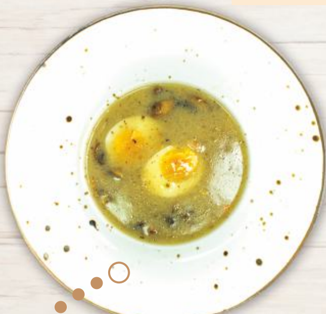
Żurek z Wolicy z jajkiem, kiełbasą i grzybami