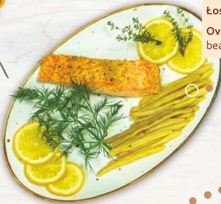
Łosoś z Pieca z fasolką szparagową Oven - Baked Salmon with green beans