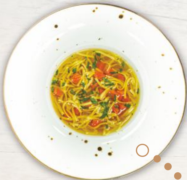
Rosół z makaronem Chicken Soup